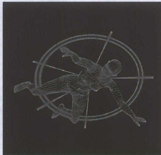
Sin título (ciencia ficción), 2001. Marina Núñez

Según el mismo Popper, el campo de estudio propio de la sociología son estos subproductos colectivos, lo que, de ser cierto, significaría que la sociología se puede relevar del análisis de algunas de las complejidades psicológicas del ser humano (si bien no de todas ellas), y que las interacciones humanas que dan pie a la aparición de estos subproductos colectivos pueden ser «aproximadas» mediante los modelos de interacción entre cuerpos en cuyo estudio tienen una amplia experiencia los físicos. ¿No puede acaso la física estadística, que se ocupa del comportamiento colectivo de sistemas, como las moléculas de un gas en un recipiente, decirnos algo útil sobre los resultados no intencionados del comportamiento colectivo de los seres humanos? (Ball, pp. 10 y 40-41). Quien encuentre provocadoramente reduccionista este enfoque debería, antes de ensartar los trenos habituales y consabidos, tomarse unos minutos de respiro y examinar sin prejuicios los rendimientos de esta perspectiva en algunos casos concretos.